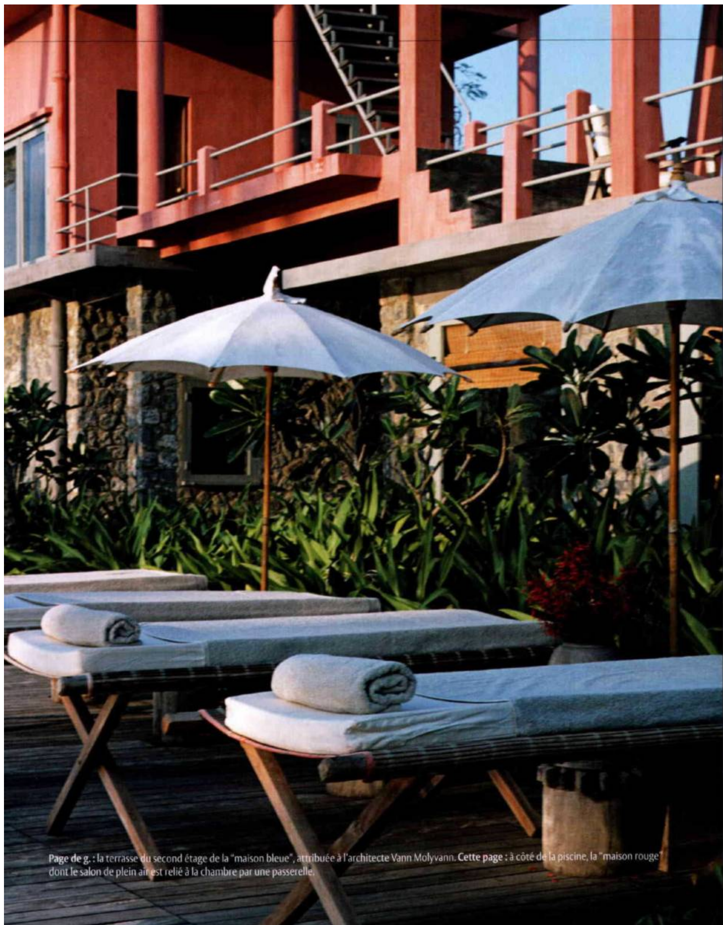
Page de g. : la terrasse du second étage de la "maison bleue", attribuée à l'architecte Yann Molyvann. Cette page : à côté de la piscine, la "maison rouge" dont le salon de plein air est relié à la chambre par une passerelle.